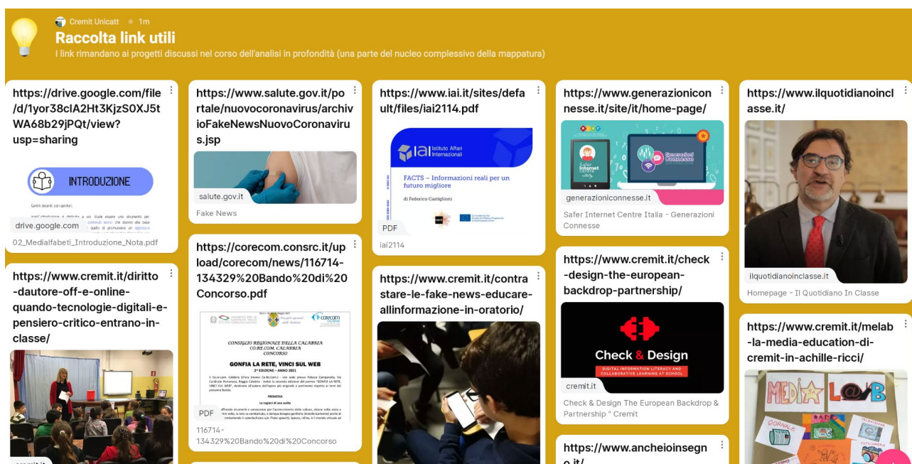
Figura 8: Screenshot dalla bacheca di Padlet che colleziona i link ai progetti descritti attraverso i marker (aggiornato a marzo 2022).