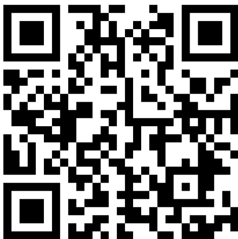
Figura 9: QR code per accedere ai progetti descritti attraverso i marker.