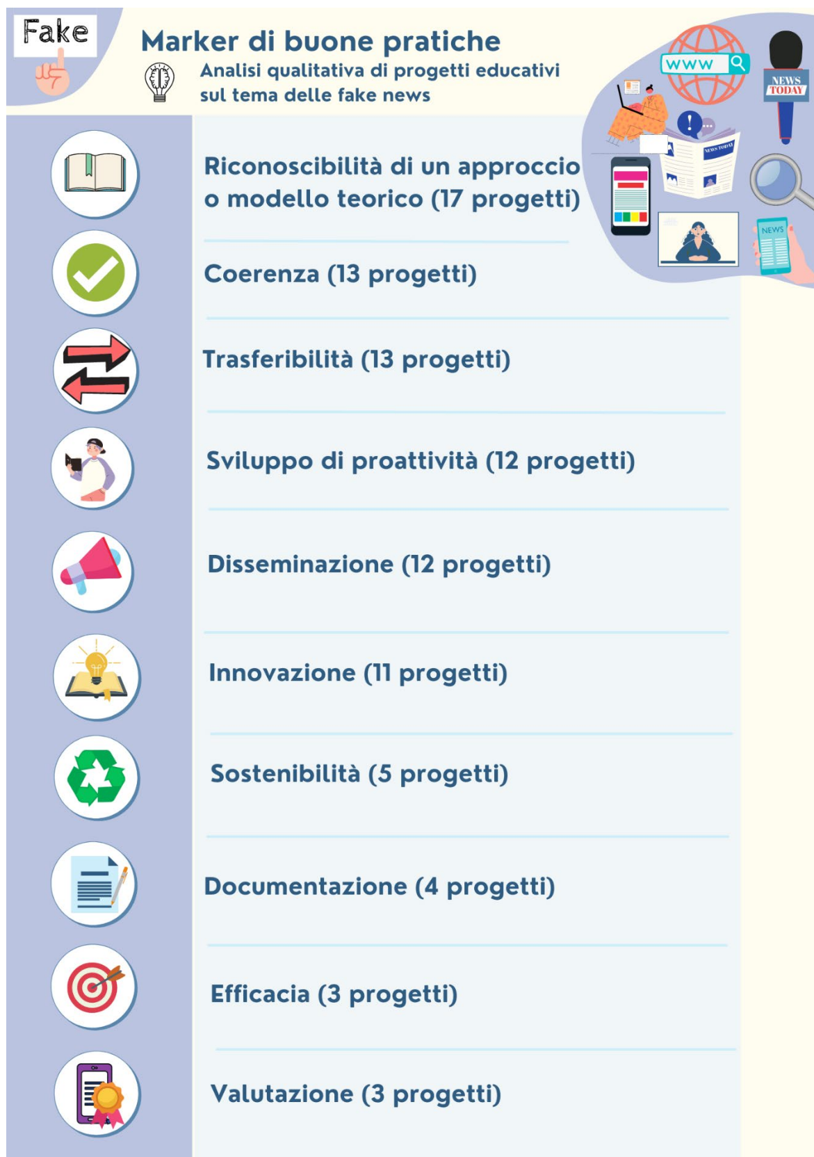
Figura 6: Sintesi dei marker di buone pratiche.

evidenze e prove. Lo ribadiamo per non restituire un'immagine falsata e non veritiera della ricchezza dei lavori mappati e analizzati.